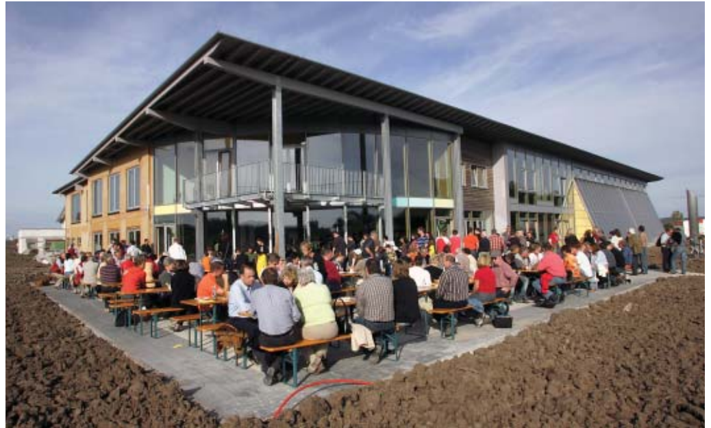
Mehrere tausend Gäste nutzten die Gelegenheit, das Sonnen-Zentrum am Eröffnungswochenende kennen zu lernen.

Ein Modellprojekt für energiebewusstes Arbeiten, Leben und Genießen