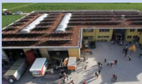
342 monokristalline Solarstrommodule und 20 Dünnschichtmodule sind auf dem Sonnen-Zentrum installiert. Insgesamt haben sie eine Spitzenleistung von 58,1 kWp.