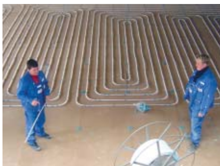
Fußbodenheizungen sind ideal für Fliesen- und Steinfußböden.