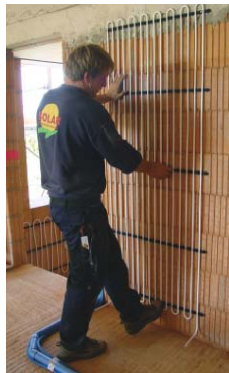
Wandheizflächen gibt es als montagefertige Unterputz-Heizregister oder als Heizpaneele für den Trockenbau.

heizsystemen sinkt durch eine niedrigere Behaglichkeitstemperatur und geringere Lüftungswärmeverluste der Energiebedarf. Außerdem ist die Vorlauftemperatur so niedrig, so dass die Systeme optimal mit Sonnenkollektoren, Kombi- und Pufferspeichern und Holzheizungen kombiniert werden können.