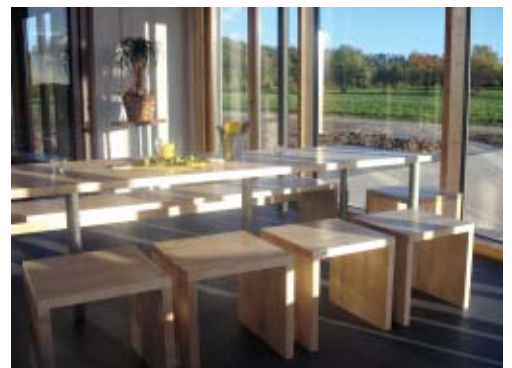
Ein Ort zum Verweilen: Die „Sonne – die feurige Gastronomie“ lockt mit Köstlichkeiten aus dem Holzbackofen und einem Blick ins Grüne.

Mehrere tausend Besucher nutzten die Gelegenheit, das Modellprojekt für energiebewusstes Arbeiten und Leben an dem Eröffnungswochenende kennen zu lernen. Seitdem ist der Besucherstrom nicht mehr abgerissen. Schüler und Arbeitskollegen, Studenten, Politiker, Privatleute und viele andere finden den Weg in das 1.400-Seelen-Dorf, um sich im Sonnen-Zentrum über ökologisches Bauen und Heizen mit Sonne & Holz zu informieren. Oder sie kommen einfach nur in das Restaurant, das mit Köstlichkeiten aus dem Holzbackofen aufwartet. ▶