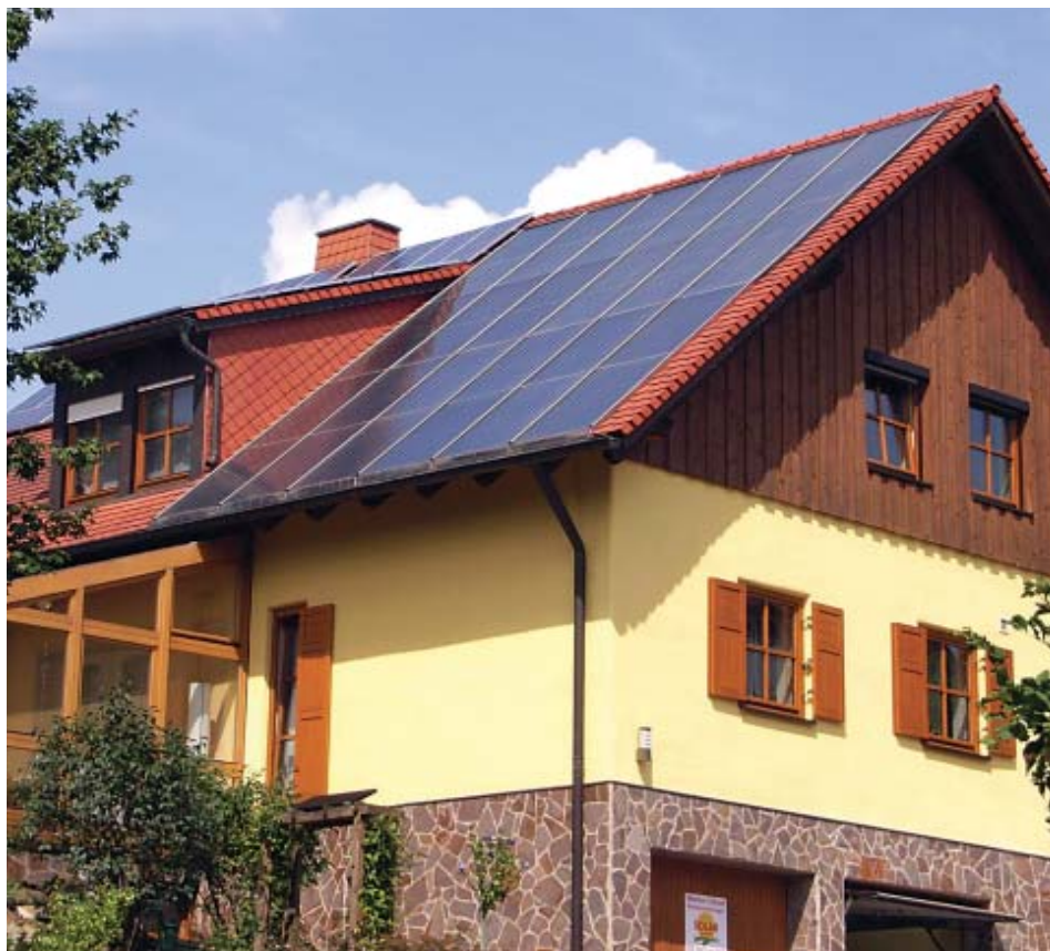
In drei Schritten hat Klaus Schmitt sein Einfamilienhaus von 1987 zum Sonnenhaus umgebaut.

Um einen so hohen solaren Deckungsgrad zu erreichen, hat Klaus Schmitt Teile der Außenwände gedämmt, eine Wandheizung eingebaut und die alten Fensterscheiben mit einem U-Wert von 2,1 W/m 2 K durch dreifach verglaste Isolierfensterscheiben (U-Wert 0,7 W/m 2 K) ersetzt. „Das Endstadium ist aber noch nicht erreicht“, betont der Installations- und Heizungsmeister. „Der Vollwärmeschutz